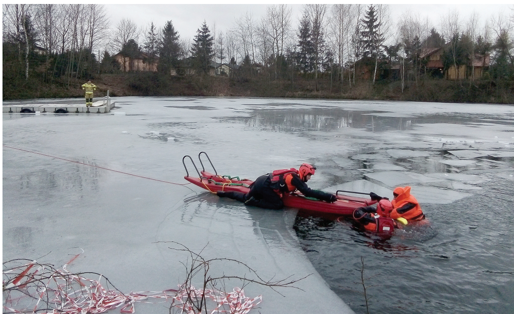
Trening ewakuacji poszkodowanego

Osobom, pod którymi załamał się lód, w wielu przypadkach są w stanie pomóc świadkowie zdarzenia. Jeśli zachowają szczególną ostrożność, mogą wykorzystać przedmioty znajdujące się pod ręką – np. szalik, długą grubą gałąź, kij hokejowy czy sanki. Wybierając się na zamarznięte akwenu, przeczornie warto wziąć ze sobą kolce lodowe, by w razie wypadku podjąć próby