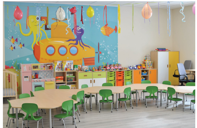
Wyposażenie sali zabaw