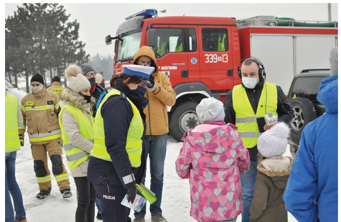
Akcja w Bestwinie