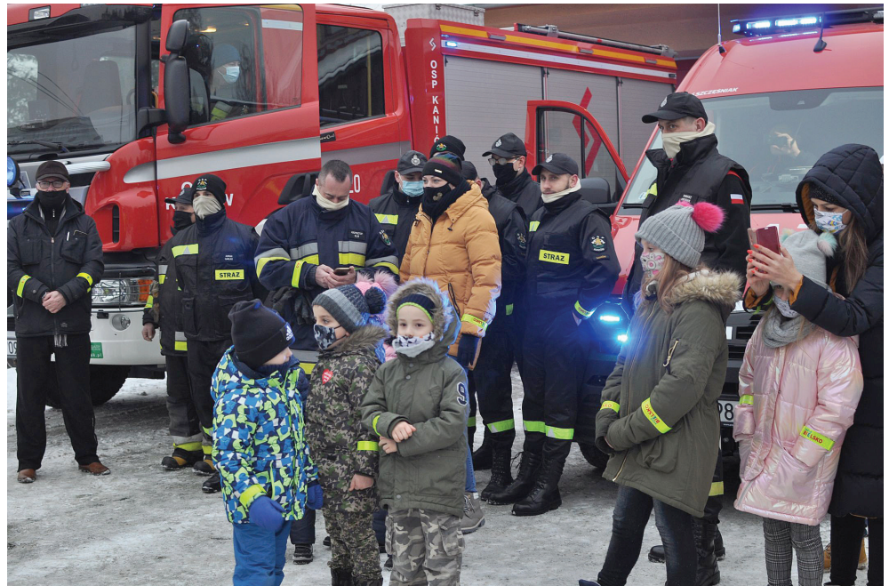
Strażacy z OSP i najmłodszy mieszkańcy Kaniowa