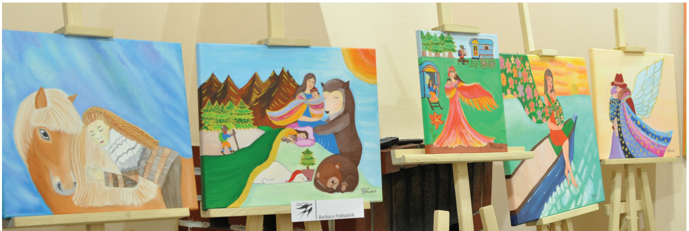
Obrazy Barbary Pokładnik cechują się niezwykłą kolorystyką