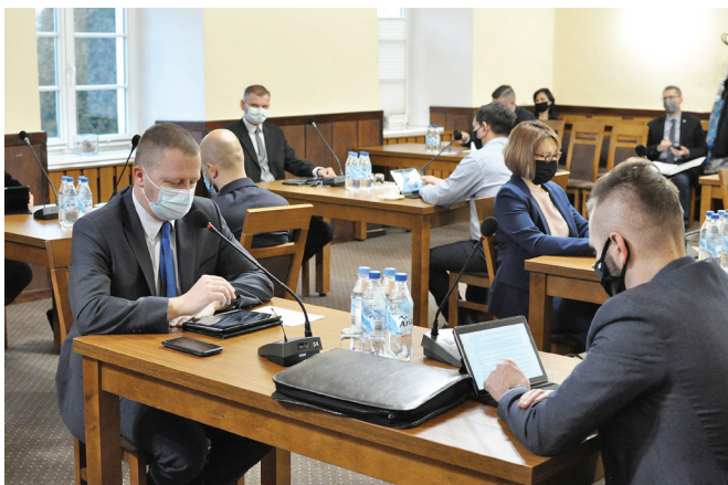
Radni podczas podejmowania uchwał