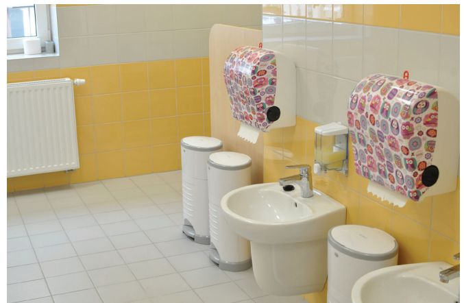
Łazienka przystosowana do potrzeb dzieci