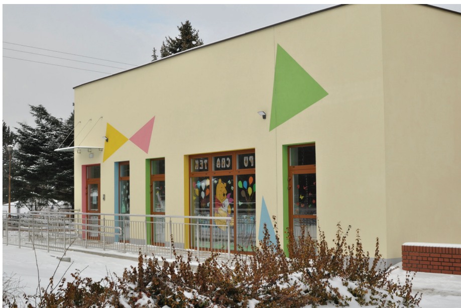
Klub dziecięcy „Puchatek”