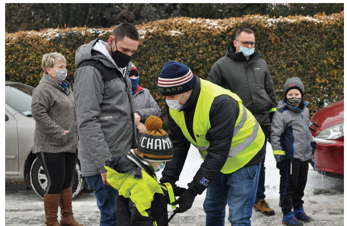
Z mieszkańcami Bestwinki